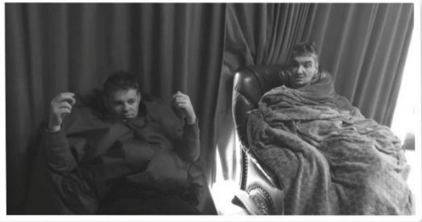
Alle zorgen laten verdwijnen en chillen maar...

Liep alles perfect? Verre van, maar onze cliënten vonden het hemels!