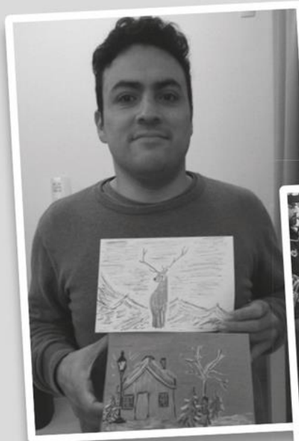
Kaartjes? Die maken we zelf