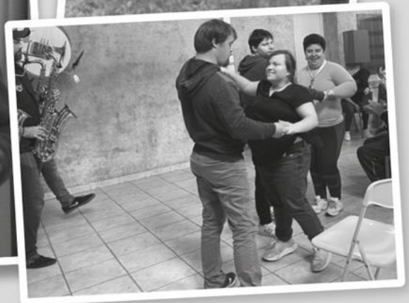
De G-bloezers op bezoek – ambiance verzekerd!