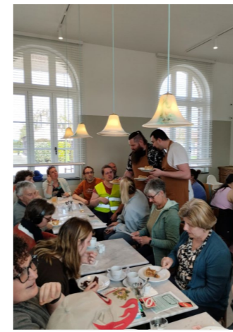
Taart smaakt dubbel zo lekker na een fikse wandeling!