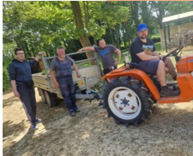
Uiteraard wilden we ons terrein pico bello om onze bezoekers goed te onthalen!