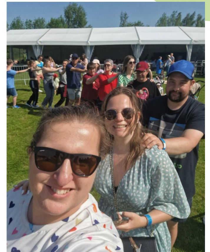
Een vrolijke verbondenheid op het G-festival!