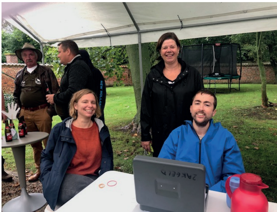
We zijn er helemaal klaar voor!