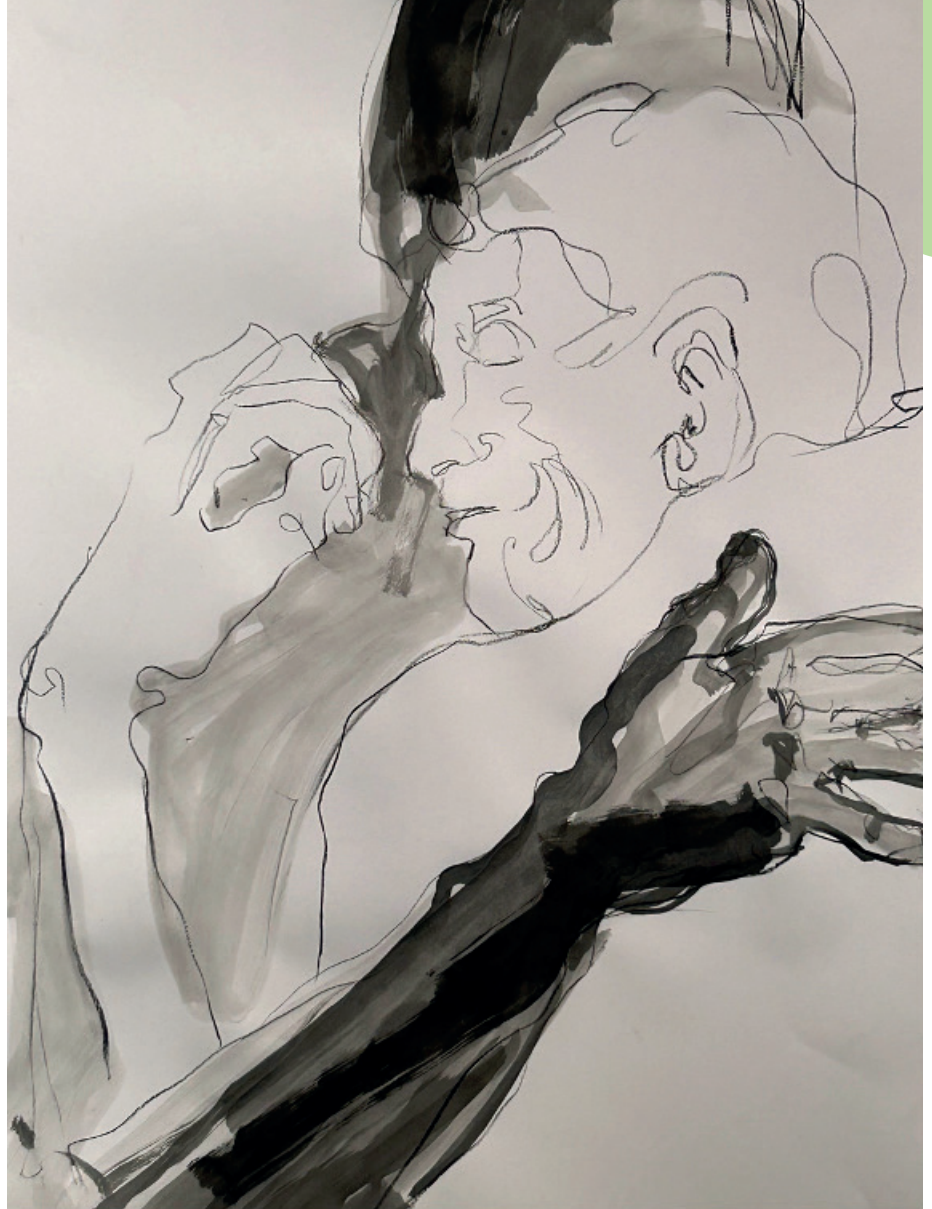
illustratie van Lieve Bollaert

Rachelle voelt zich gelukkig als het goed gaat met de bewoners: "Ik doe mijn best om hen rustige momenten te bezorgen, steeds rekening houdend met de collega's. Als ik op het eind van mijn shift merk dat bewoners rustig en blij zijn, ben ik zelf ook blij."