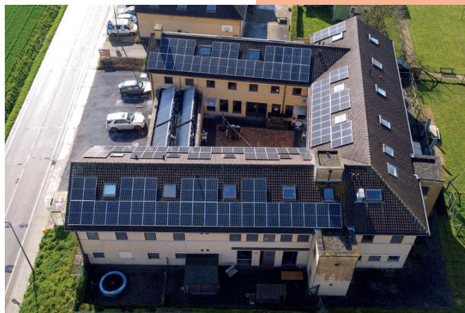
De Okkernoot Vollezele