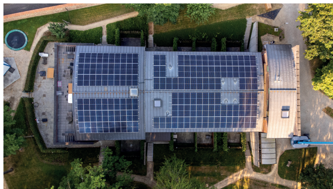
De Okkernoot Denderwindeke