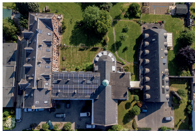
De Okkernoot Halle