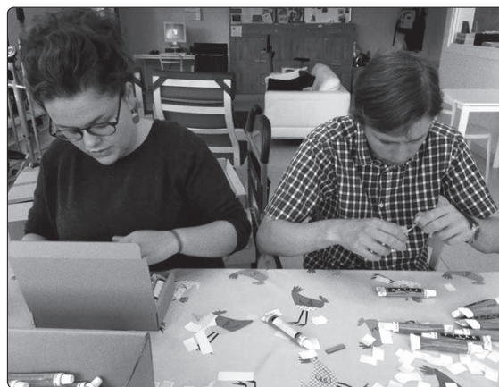
Semi-industrieel werk waarbij stickers moeten geplakt worden op een tube lijm of hoe werken rust kan brengen...

En wat is er dan leuker dan even aankloppen bij de buurvrouw voor een babbel en een kop koffie!